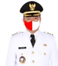
YULHAIDIR Bupati Seruyan Setahu Ketua Gugus Tugas Penanganan COVID-19 Kabupaten Seruyan

SULING TAMBUN SUSPEK = 0 KONFIRMASI = 0 SEMBUH = 0 MENINGGAL = 0