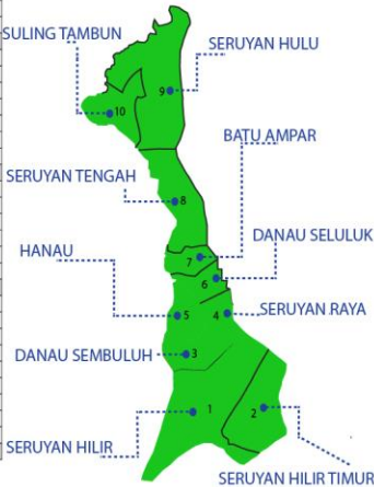
Keterangan warna Peta