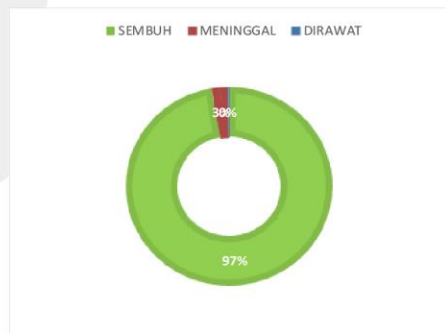
PERSENTASE KONDISI PASIEN COVID-19 KABUPATEN SERUYAN

sumber data : Dinas Kesehatan Kabupaten Seruyan