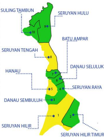
Keterangan warna Peta