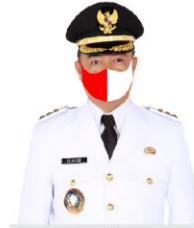
YULHAIDIR Bupati Seruyan Setahu Ketua Satuan Tugas Penanganan Covid-19 Kabupaten Seruyan