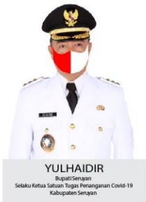
YULHAIDIR Bupati Seruyan Setahu Ketua Satuan Tugas Penanganan Covid-19 Kabupaten Seruyan